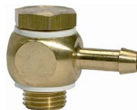
74-046 (Abbildung ähnlich)